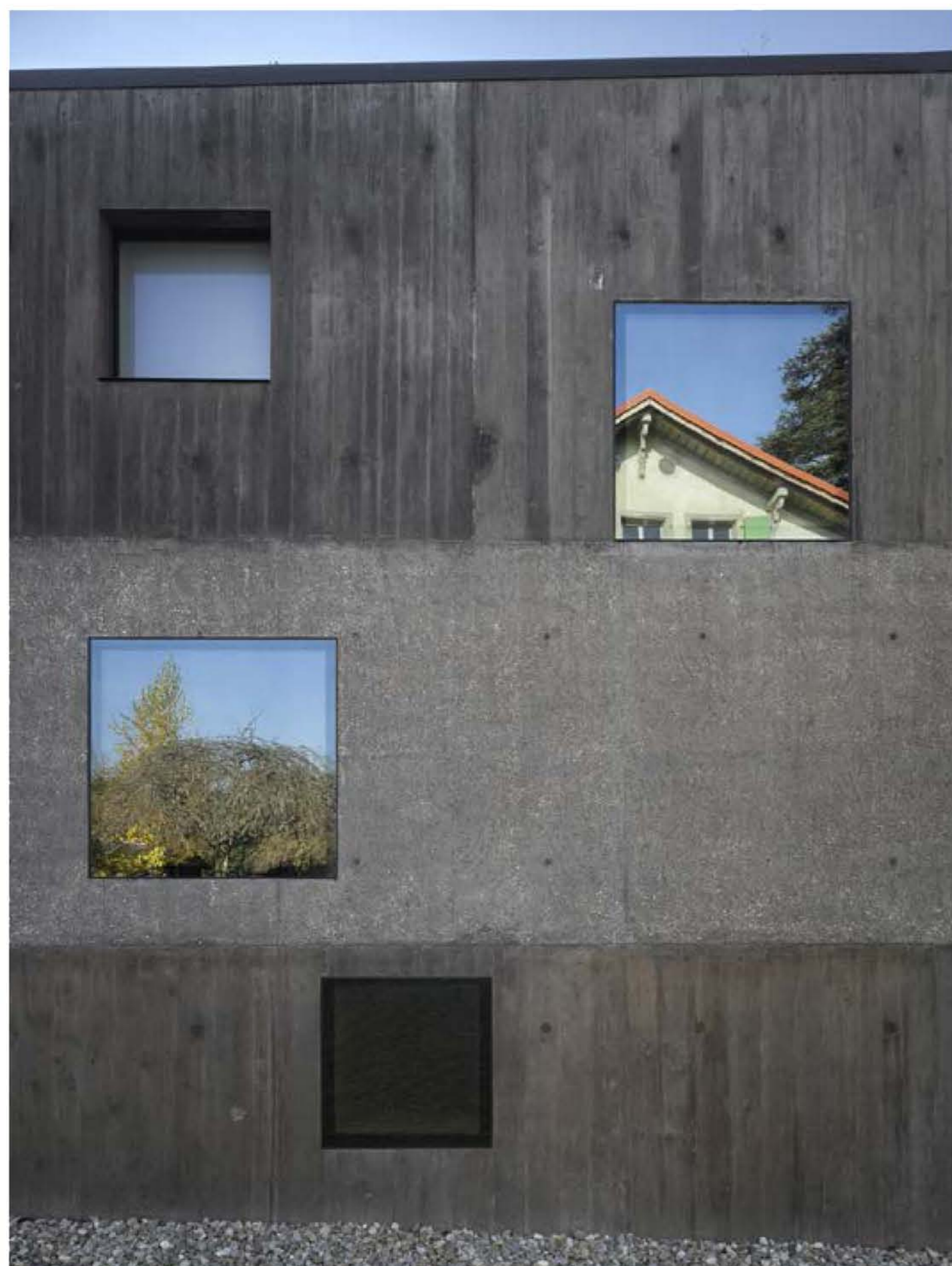
2B ARCHITECTES, VILLA URBAINE 4 EN 1, BEAUMONT