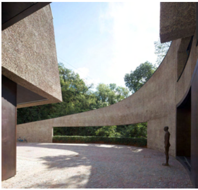
Casa del collezionista a Bolzano