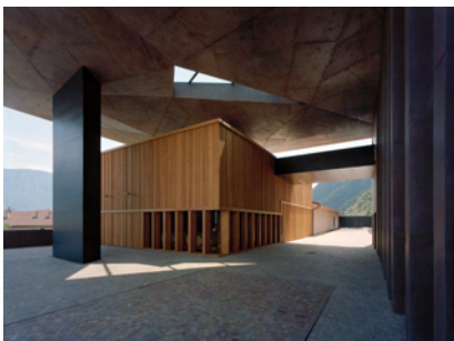
Cantina Nalles Magré a Nalles