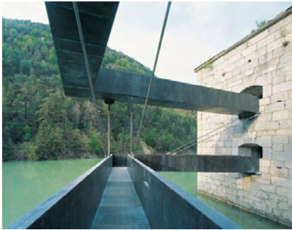
Percorso museale a Forte di Fortezza