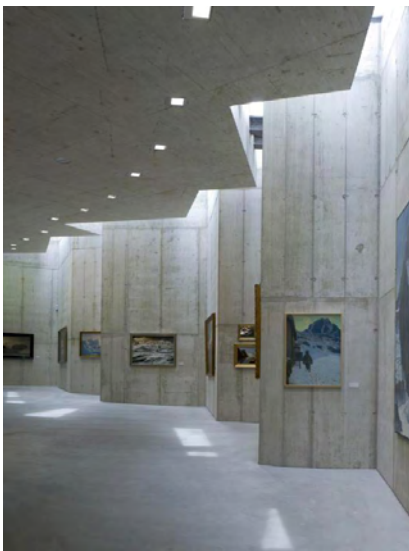
Messner Mountain Museum a Solda