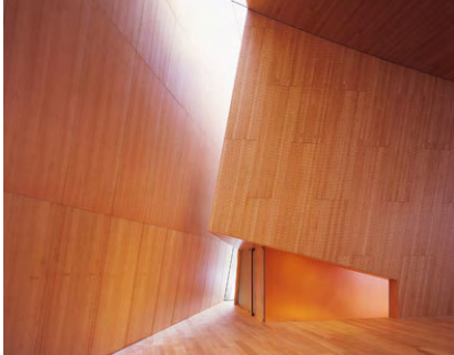
Ampiamento chiesa di Laives