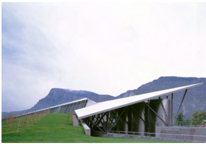
Cantine Rotari a Mezzocorona