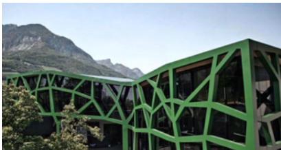
Cantina sociale di Termeno