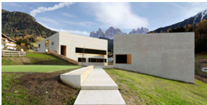
Centro visite parco Puez-Odle a Funes