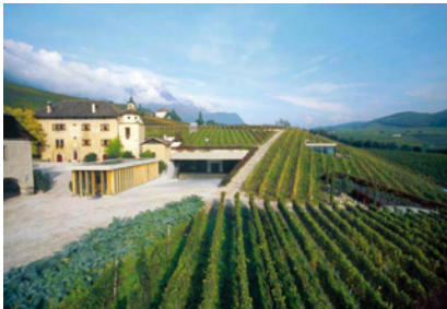
Tenuta Manincor a Caldaro