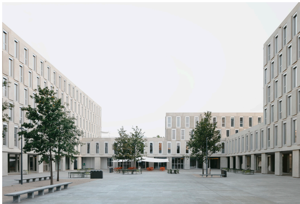
Campus USI-SUPSI, Lugano-Viganello, Consorzio Architetti Simone Tocchetti e Luca Pessina