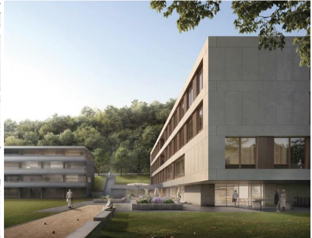
Progetto TRILITE, 1° rango, Itten+Brechbühl SA , Paradiso